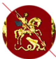
Всадник скачет, а не едет

Элементы герба не должны противоречить описанию в законе: