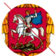
Всадник неправильно повёрнут