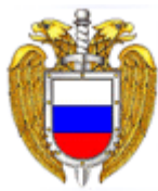
Федеральная служба охраны